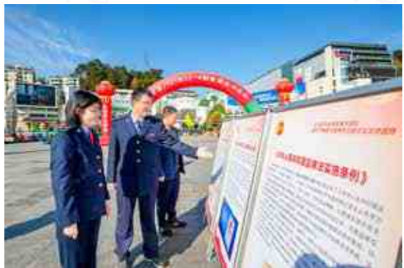
淳安县纪委监委结合国家宪法日普法宣传活动，通过普法展板、现场讲解等方式开展宣传。