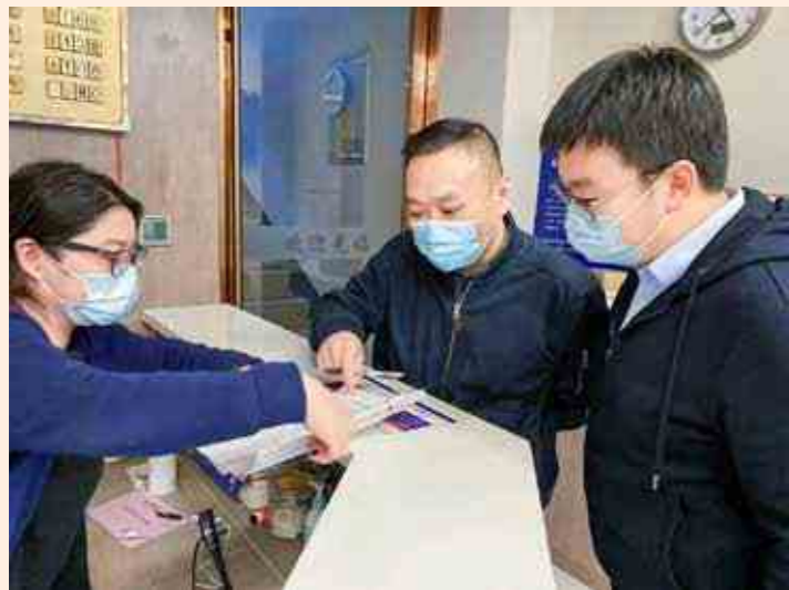
杭州市纪委监委专项监督组对重点场所疫情防控措施落实情况开展明察暗访。