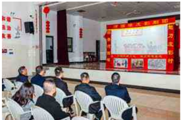
临平区塘栖镇纪委将“两法一条例”植入皮影剧目等非遗文化，为当地百姓送上丰盛的“法治文化大餐”。