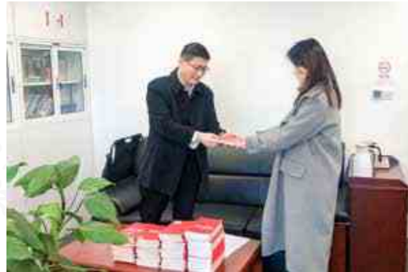
上城区委直属机关纪检监察工委向58家区直单位发放《监察法》《公职人员政务处分法》《监察法实施条例》，提升机关纪检监察干部的法治意识。