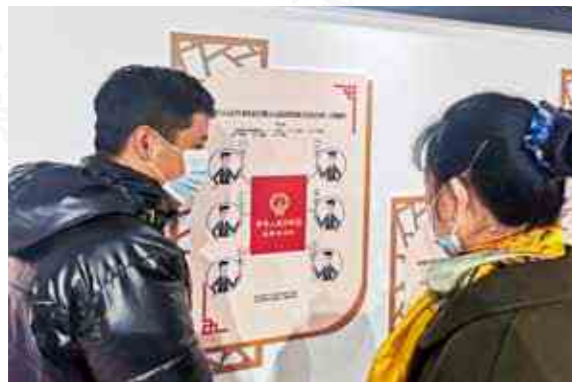
钱塘区白杨街道纪工委在街道党群服务中心开展“两法一条例”普法宣传，生动形象的漫画吸引了党员群众前往学习。