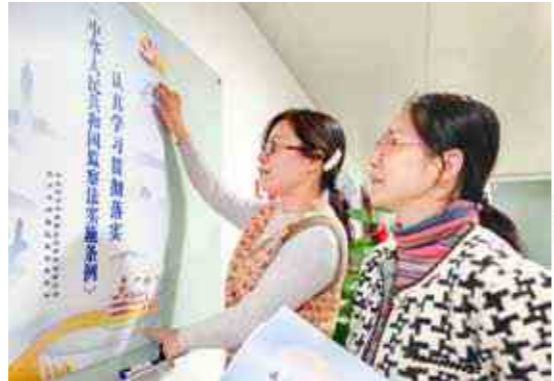
拱墅区纪委监委通过印发学习资料汇编、开辟微信公众号专栏连载、编发宣传海报折页等形式，积极推广学习“两法一条例”。