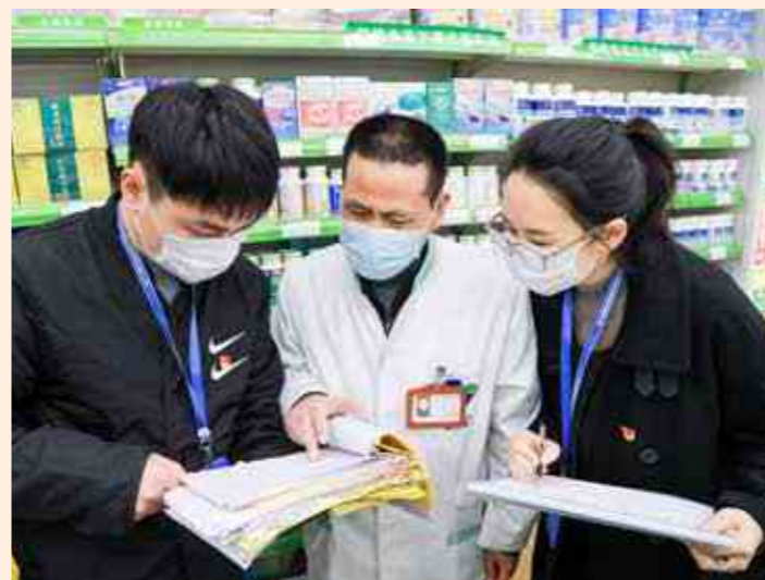
西湖区纪委区监委工作人员深入沿街药店，检查不得销售的四类药品台账清单情况，以及扫码核验、测温、戴口罩等“三个100%”要求落实情况。