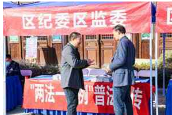
余杭区纪委监委面向基层群众开展“两法一条例”普法宣传工作，充分营造尊法学法守法用法的浓厚氛围。