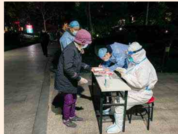
上城区小营街道纪工委全体人员投身抗疫第一线，参与长明寺巷封闭范围内居民三轮全员核酸筛查工作。

连日来，杭州市纪委监委密切关注疫情动态，全市纪检监察干部下沉一线，先后出动515批次，累计1225个监督检查组，对全市范围内6321个场所开展实地监督检查，发现并督促问题整改1574个，提出意见建议601条。