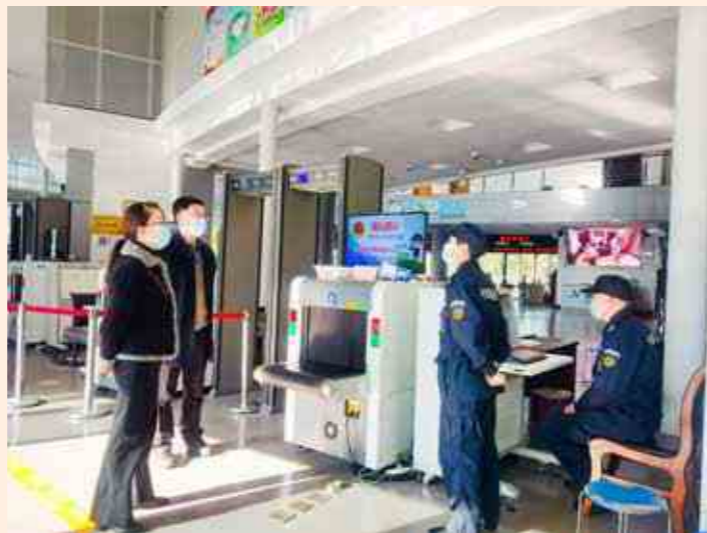
淳安县纪委监委派驻第四纪检监察组在千岛湖旅游码头督查疫情防控工作落实情况。